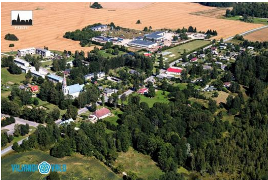
Paistu küla /2015/Foto: Veiko Jüris

Paistu küla ja MTÜ Paistu Kultuuriseltsi arengukava 2015-2025 on koostatud 2015.aastal