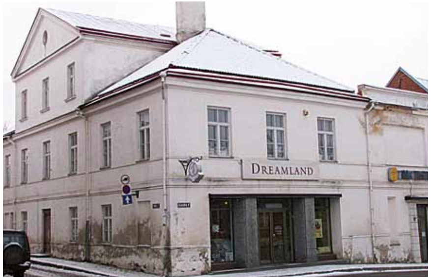
Uue valla uus keskus tuleb Kauba ja Pika tänava nurgal seisvasse ajaloolisesse hoonesse mis praegu kuulub aktsiaseltsile Toom Tekstiil. MARGUS HAAV

Leola Kinnisvara OÜ pakkus rendile ruume Mainori majas, seal oli kolmandal korrusel pinda ligi 500 ruutmeetrit hinnaga 4 eurot ruutmeeter, millele lisanduksid käibemaks ja kommunaalkulud. See teeks kümne aasta jooksul vallale rendikulu 288 000 tuhat eurot. Orienteerivalt sama hinnaga on võimalik soetada juba oma maja. 18. novembril otsustas