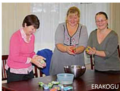
Rahvamajas sai ka viltimist proovida.

Keldrisaalis sai uhiuute telgedega kalgutsuipa kududa. Kõik külastajad said oma head soovid vaiba sisse kududa. Vaiba kingime oma uuele vallale. Kudumise