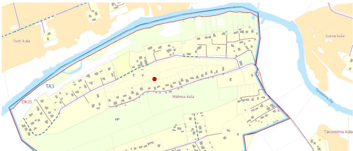
Joonis 2 Metsaroosi asukoht markeritud punktiga

Ettepanekuga ei ole arvestatud. Maakasutuse juhtotstarve on PlanS § 6 p 9 kohaselt  ldplaneeringuga m aratav maa-ala kasutamise valdav otstarve, mis annab kogu m aratud piirkonnale edaspidise maakasutuse p hisuunad. Viidatud katastri ksuste n ol on tegemist selliste siiludega olemasoleva elamumaa juhtotstarbega maa vahel, mis ei loo maakasutuse p hisuunda, vaid on juhtiva otstarbe elamumaa orgaaniline osa.