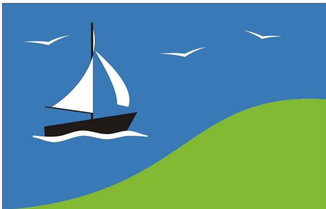
Valma küla lipp (autor Vello Kütt)