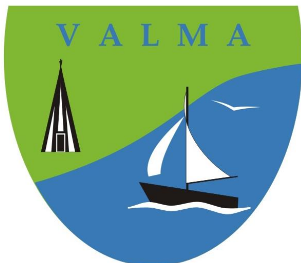
Valma küla vapp (autor Vello Kütt)